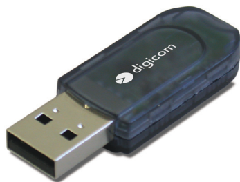
Palladio USB Bluetooth EDR 100 & Palladio USB Bluetooth EDR 10