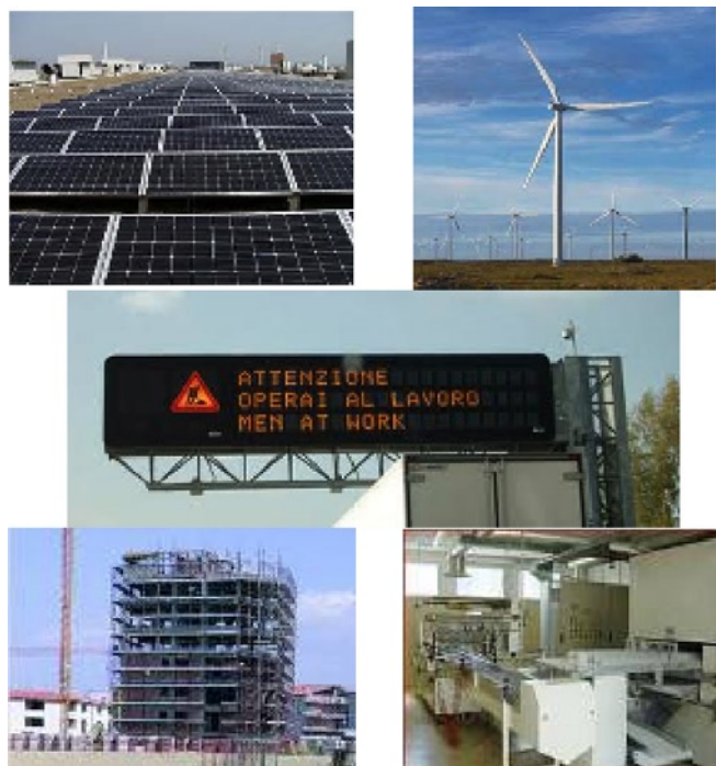
Alcuni dei possibili campi di utilizzo