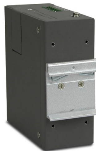
Fissaggio guida DIN